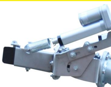
Ausswurf mit Kunststofflippe