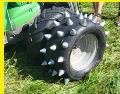
Auch als Doppelrad